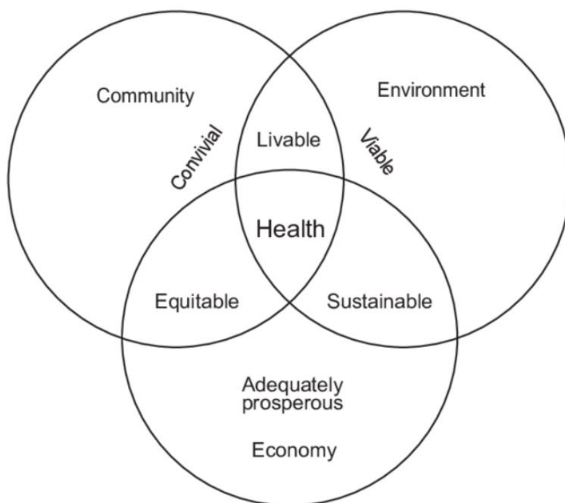
圖 2：健康和社區生態系統模型（Hancock，1993）

是一個自主過程，以整個社區為導向」，換言之，就是運用社區營造理念，將社區人的健康狀態，朝向健康促進的目標邁進，使社區逐漸走向一個健康城市的理想境界（劉潔心，2001）。在 SDGs 的目標 3：確保健康的生活並促進各年齡階段的福祉，積極促進世界各國關注健康與永續之議題，除了採取的公共衛生措施外，也在健康心理層面的關懷部分作了一些努力和支持行動。各國政府正在設計干預措施，通過解決社區社會資本水平問題來改善健康和福祉（Putland, Baum, Ziersch, Arthurson and Pomagalska, 2013）。Hancock (1993) 提出理想的健康城市的特性分類（圖 2），已跳脫傳統衛生醫療的概念，加入永續發展的環境理念，更重視民眾參與與社會支持等面向，試圖轉化既有的資本觀念放到健康社區的領域中，考慮如何與私部門合作。